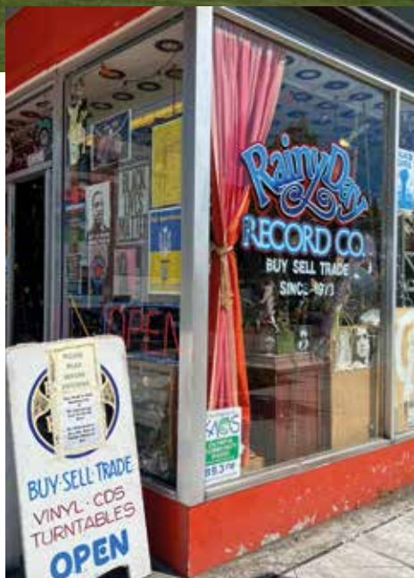
Plattenladen in Olympia.

In der Geschichte der Rock'n'Roll nimmt Seattle einen prominenten Platz ein. Das liegt zum einen an Jimi Hendrix, der das Genre in den 1960er-Jahren durch sein virtuosos Gitarrenspiel quasi im Alleingang revolutioniert hat. In den späten 1980ern waren es dann Bands wie Nirvana, Pearl Jam, Soundgarden oder Mudhoney, die Seattle abermals in den Fokus rückten. Ihr als Grunge-Musik berühmter Stil trat bald einen Siegeszug ohnegleichen an und machte die Stadt am Puget Sound über Jahre hinweg zur inoffiziellen Kapitale der Indie-Szene. Das Plattenlabel Sub Pop (mit Shop in Downtown Seattle) und der Crocodile Club in Belltown halten dieses Image bis heute lebendig.