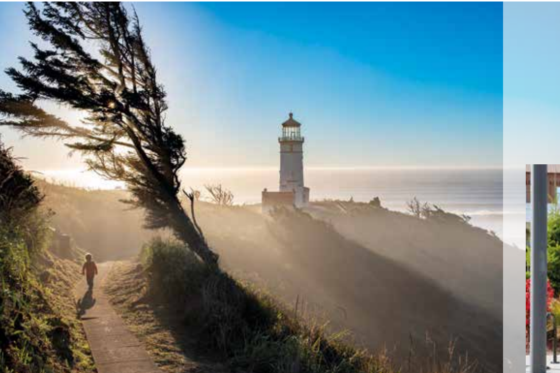
Windzerzaute Küste am Cape Disappointment.

Im äußersten Nordwesten gelegen, vereint er alpine Bergketten wie die North Cascades mit einer vielerorts unberührten Küstenlinie und sanfte Weinberge mit den Inselwelten des Puget Sound. Hinzu kommen imposante Vulkankegel wie der Mount Rainier und die Weltstadt Seattle, die sich dank reichhaltigen Kulturlebens, innovativer Gastro-Szene und einer bevorzugten Lage hinter keiner Metropole verstecken muss. Auf einer Fläche etwa halb so groß wie Deutschland, aber nicht einmal einem Zehntel seiner Einwohner, bietet Washington State reichlich Spielraum für Abenteuer und Entdeckungen. Weil jede Jahreszeit ihren Reiz hat und der Flughafen Seattle-Tacoma nonstop von Frankfurt angefliegen wird, ist Washington State stets ein herrliches Urlaubsziel.