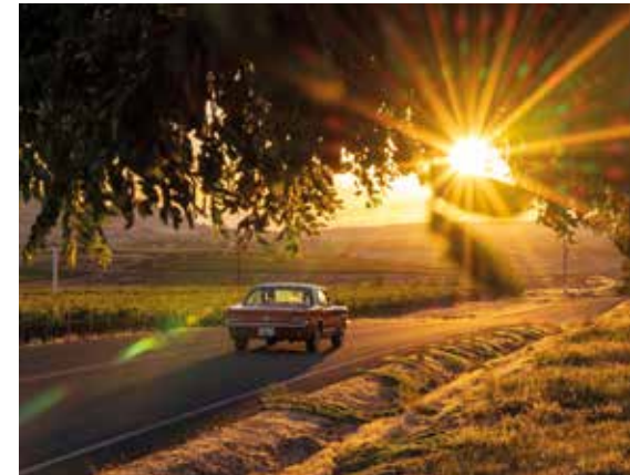
Prosit! Die Winzer im Wine Country laden zum sonnenverwöhnten Tasting ein.