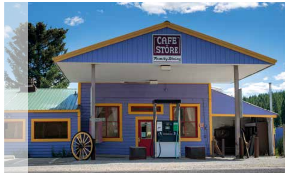
Diner in Ponderosa und Wasserfälle in Spokane.