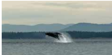
Buckelwal vor Friday Harbor.

→ visitsanjuans.com → whidbeycamanoislands.com