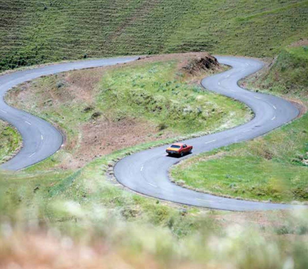
Einladung zum Fahrgegnuss: Landstraße in Washington.