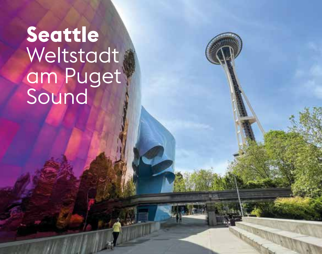
In Sichtweite: Space Needle und Museum of Popular Culture.

Seattle besitzt alles, was eine Weltstadt ausmacht. Spektakulär an der Elliott Bay gelegen, ist die Metropole dank ihrer Skyline schon von weitem sichtbar. Die imposanten Wolkenkratzer verleihen Downtown mit ihren vielfältigen Einkaufsmöglichkeiten ein typisch amerikanisches Gesicht. Der erste Eindruck aber vermittelt längst nicht alle Facetten: Seattle und seine so unterschiedlichen Stadtviertel sind „walkable“ und gut mit dem Rad oder per ÖPNV erreichbar.