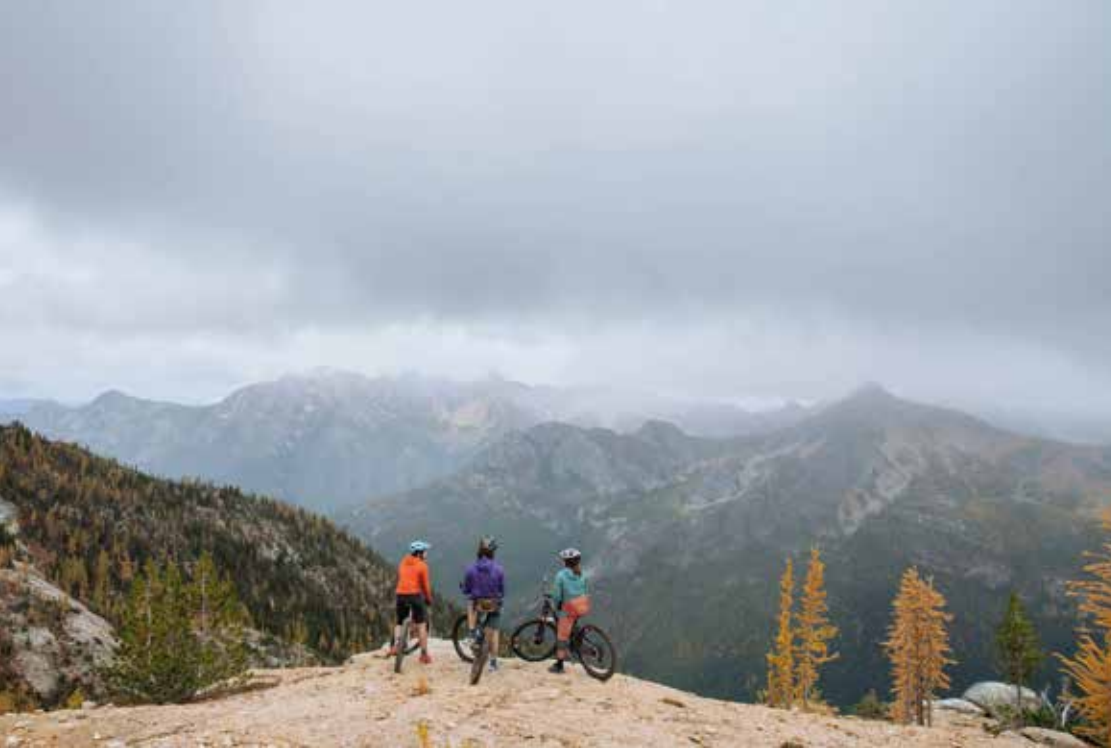
Okanogan National Forest: Paradies für Outdoor-Aktivitäten.