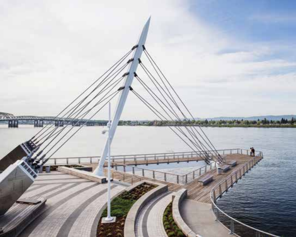
Am Columbia River: Grand Street Pier in Vancouver.