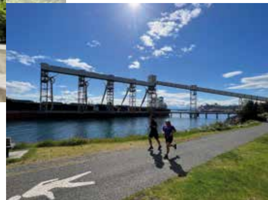
Pike Place Market (oben) und Auslauf am Port of Seattle.

Kerry Park: spektakulärer Blick auf Downtown und Hafen, bei klarer Sicht baut sich im Hintergrund Mount Rainier auf.