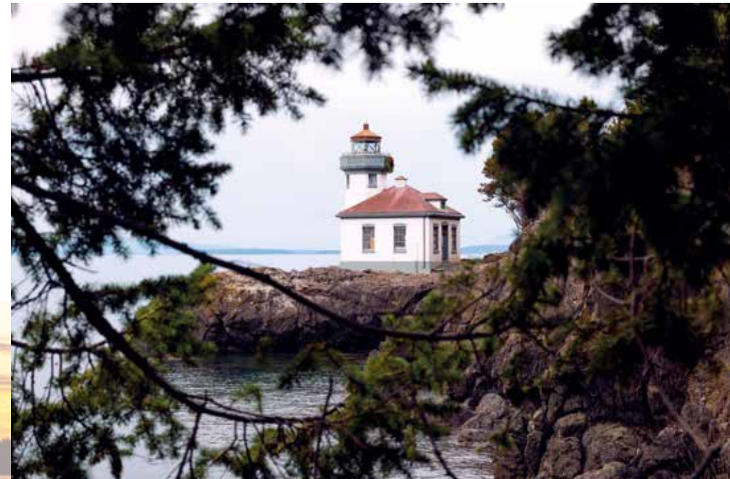
Lime Kiln Point auf San Juan.

Washingtons Nordküste wird auch als Salish Sea bezeichnet. Lebendige Städtchen wie Bellingham oder Mount Vernon belegen regelmäßig vordere Plätze auf den Ranglisten der beliebtesten Wohnorte der USA. Beide sind über den Chuckanut Drive miteinander verbunden, der als erste Straße des Staates zum Scenic Byway gekürt wurde. Von hier ist es nur ein Katzensprung bis in die North Cascade Mountains mit ihren ursprünglich anmutenden alpinen Landschaften.