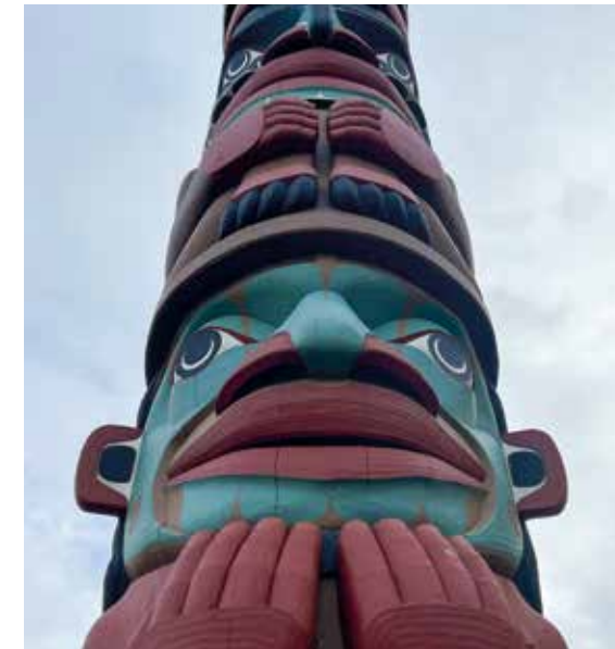
Totem in Port Townsend.

→ museumofflight.org → boeingfutureofflight.com