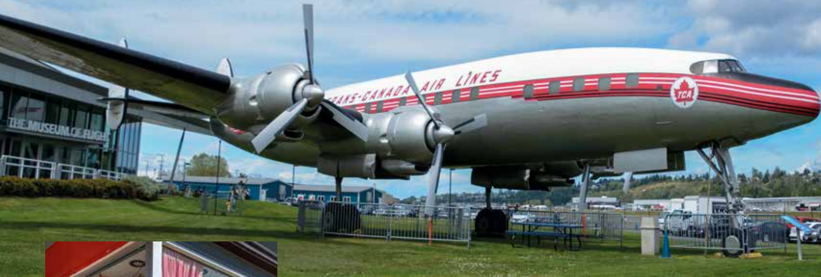
Super Constellation in Seattles Museum of Flight.