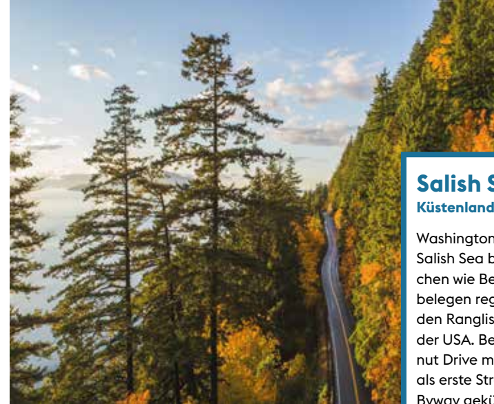
Traumstraße am Pazifik: Chuckanut Drive.