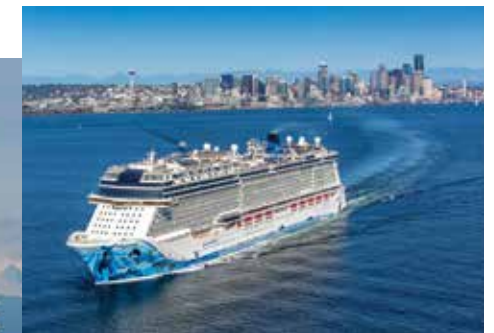
North to Alaska mit dem Kreuzfahrtschiff vom Port of Seattle.