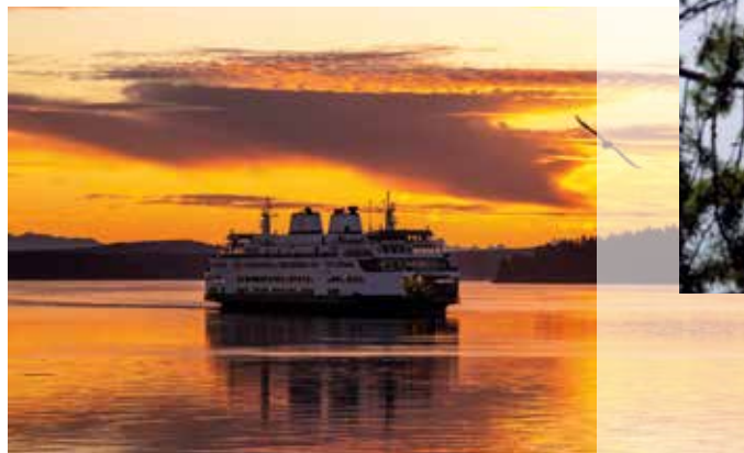
Fähren verbinden die San Juan Islands Tag und Nacht.

Der Puget Sound ist ein bevorzugtes Aufenthaltsgebiet für mehrere Walarten. Vor allem zwischen März und Oktober halten sich diverse Spezies in den Gewässern auf. Fast den gesamten Zeitraum über besteht die Chance auf die Sichtung von Orcas. Grauwale unterdessen sind in den Monaten von März bis Mai anzutreffen. Von Mai bis Oktober sind auch Minkwale und Buckelwale zu Gast in den nahrungsreichen Gewässern. Diverse Unternehmen mit erfahrenen Guides bieten Touren zur Beobachtung der Meeressäuger an.