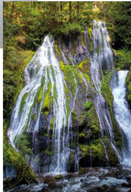
Panther Creek Falls (oben) und Klickitat River (rechts).