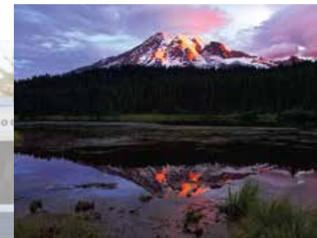
Links: Coffee Truck in Spokane. Oben: Lichtzauber am Mount Rainier.